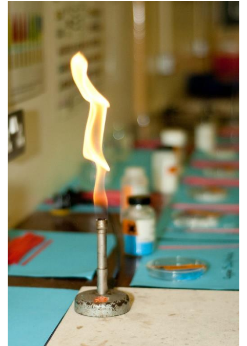
"Kingsway School - Science - Bunsen Burner" by Kingsway School is licensed under CC BY 2.0

mehr Unterricht in den Naturwissenschaften